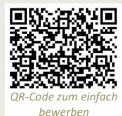
QR-Code zum einfach bewerben

Bei weiteren Fragen melde dich gerne bei Jessica unter 0234 5450583 .